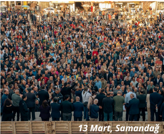
13 Mart, Samandağ

Eylem Suriye'deki Alevi katliamı sloganlarla protesto edilerek sona erdi.